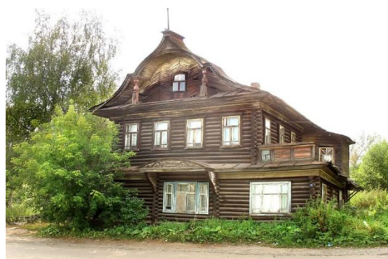
Дом старосты Носкова