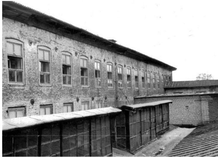
Фабрика «Знамя труда»

http://enckostr.ru/getImage.do?object=1804534729&original=1&compatible=1