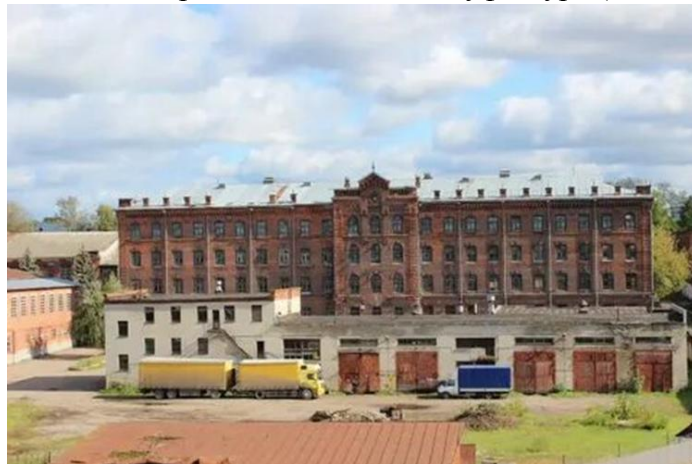
Большая костромская льняная мануфактура (БКЛМ)

https://yandex.ru/images/search?pos=2&from=tabbar&img_url=http%3A%2F%2Fphotos.wikimapia.org%2Fp%2F00%2F05%2F15%2F36%2F28_big.jpg&text=фабрика+бклм+кострома&rpt=simage&lr=7