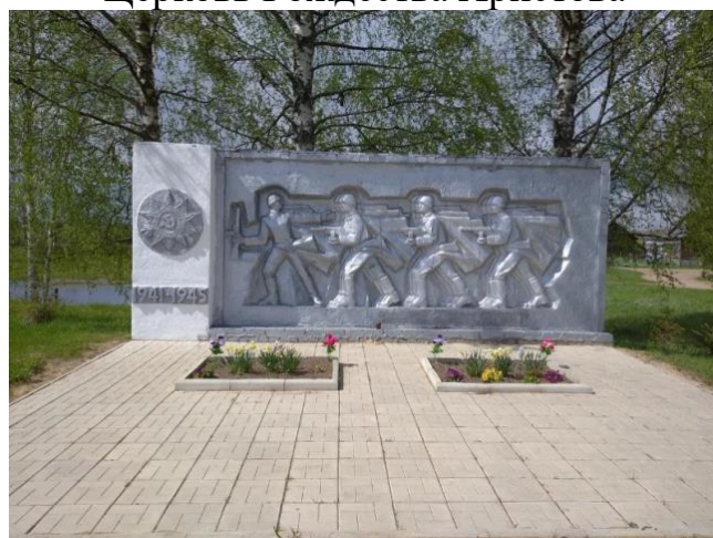
Памятник воинам, погибшим в Великой Отечественной Войне