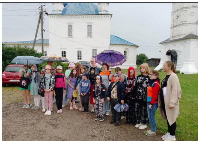
Свято-Предтеченский Иаково-Железнодорожный монастырь